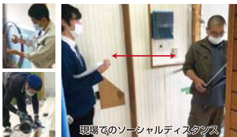
現場でのソーシャルディスタンス